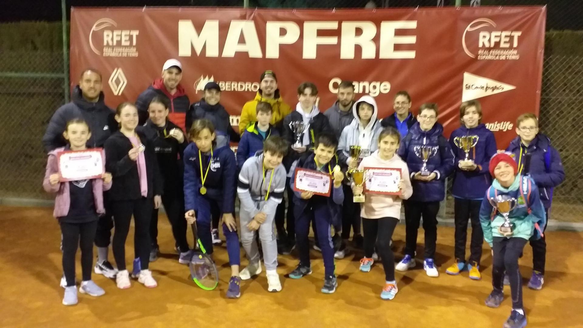
2023 ATT – N3AT01 +++ REAL SOCIEDAD DE TIRO DE PICHON +++ ATARFE 74 Participantes