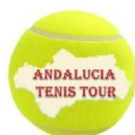
ANDALUCIA TENIS TOUR GRAFICO DE LA EVOLUCION EN LA PARTICIPACION